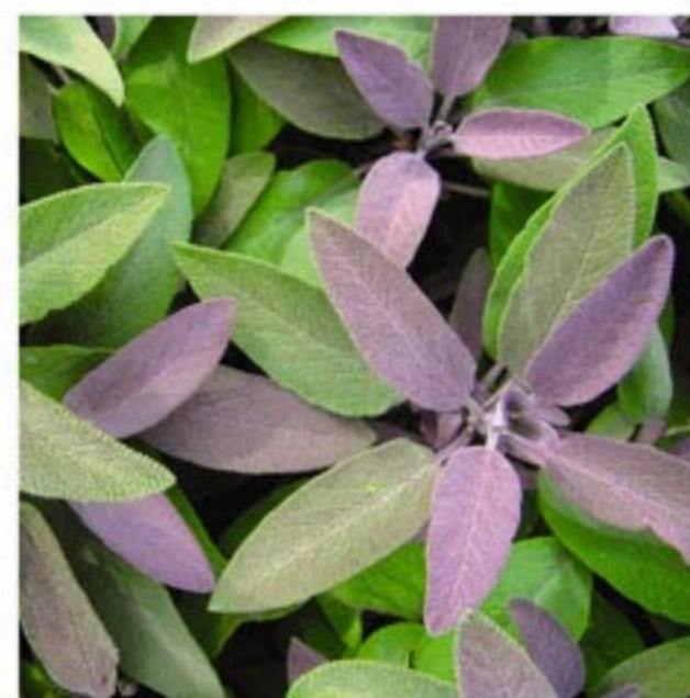
СВЕРХКРИТИЧЕСКИЙ (CO 2 ) ЭКСТРАКТ ШАЛФЕЯ И РОЗМАРИНА

Богатый эфирными маслами и дубильными веществами экстракт тысячелистника обладает противовоспалительным и антиаллергическим свойством, оказывает бактерицидное действие, способствует заживлению мелких повреждений на коже.